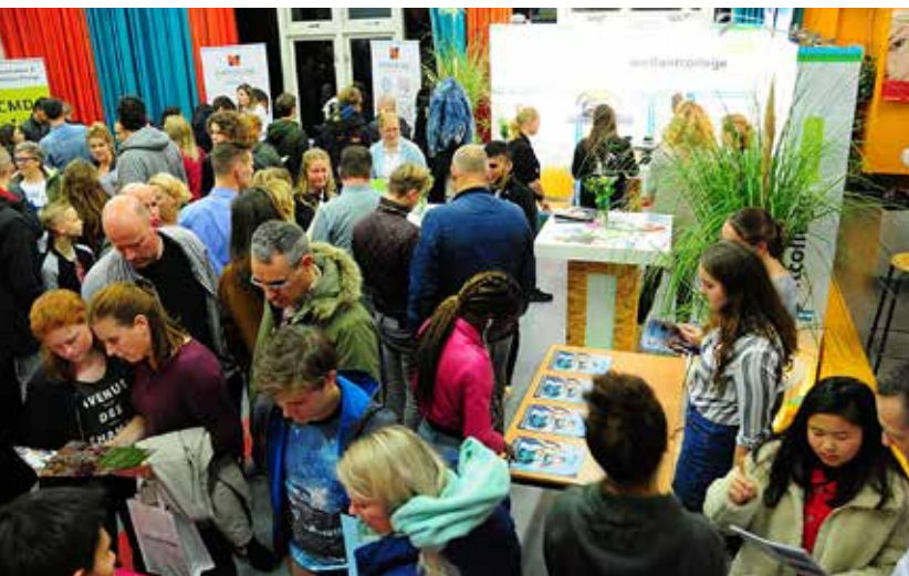
Opleidingen- en beroepenmarkt op school

In mavo-3 wordt het grootste gedeelte van het keuzeproces gedaan tijdens het vak PSO (Praktische Sector Oriëntatie). Op dit moment zijn we een economie-project aan het afronden: "Eurobiz", een project waarbij groepjes leerlingen hun eigen bedrijf op moeten richten. De andere sectoren, Groen, Zorg en Welzijn, en Techniek, komen vanaf januari aan bod. Ook gaan de leerlingen dit jaar nog stage lopen (14 t/m 18 mei), meedoen aan On Stage en werken uit "Keuzedosier".