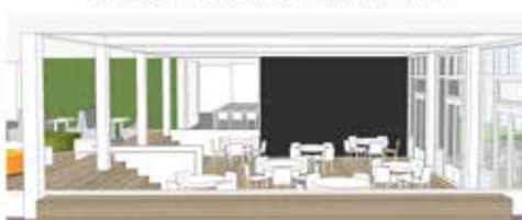
zicht op verlaagde deel vanuit gang directie