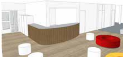
zicht op balie; nieuwe vormgeving catering - uitgifte