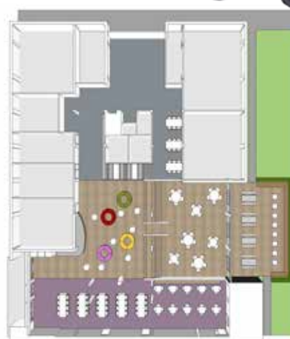
zicht boven boven: Concept. Zonering, rust, ruimte