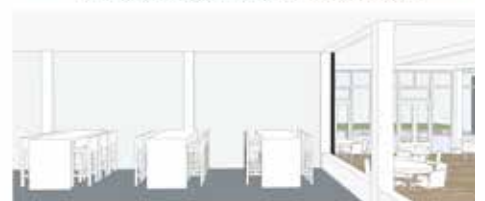
Hoge tafels aan de rand, verschillende zitplekken