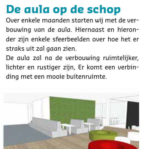
treincoupé plekken met zachte wandafwerking