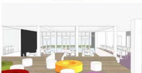
zicht op verlaagde deel en pui naar buiten